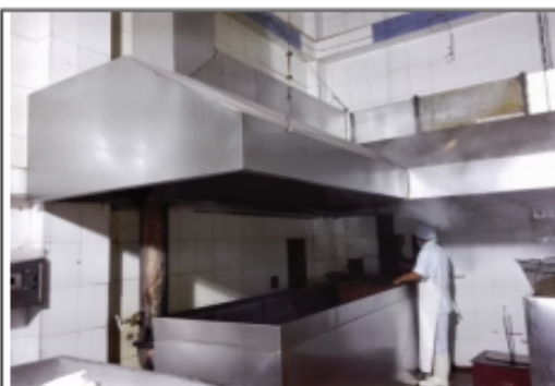
FOTOGRAFÍA 2. HORNO 1