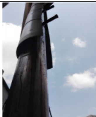
FOTOGRAFÍA 3. DUCTO DE DESCARGA