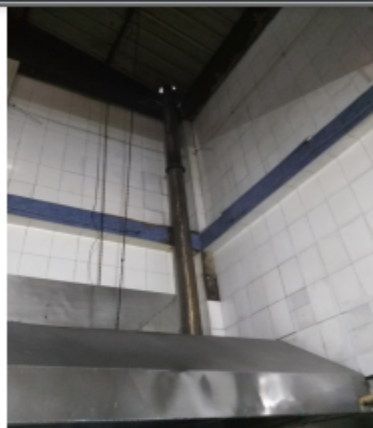
FOTO 4. DUCTO DEL QUEMADOR DEL FREIDOR 1