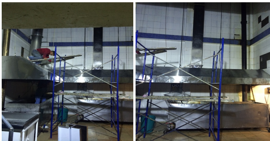
Fotografía 2 y 3. Sistemas de Captación Campana Con ducto de salida