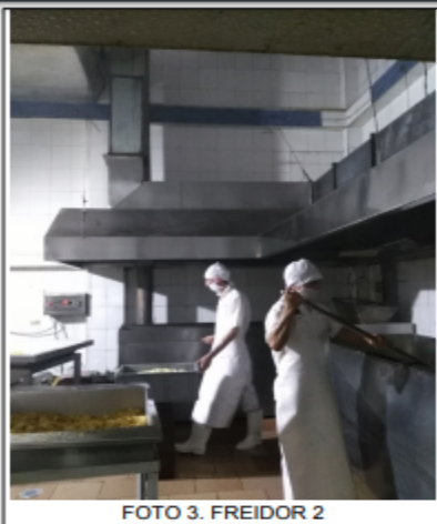
FOTO 3. FREIDOR 2