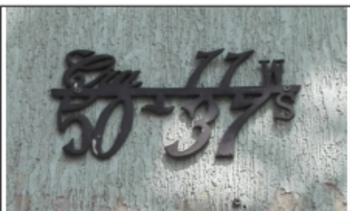
FOTOGRAFÍA 1. NOMENCLATURA DEL PREDIO