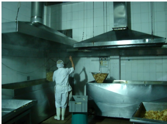
Foto 3. Freidoras y campanas