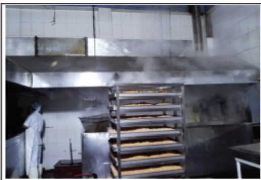
FOTOGRAFÍA 2. HORNO 2