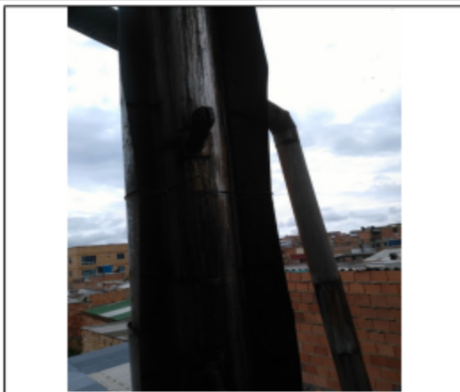
FOTO 5. DUCTO DE EXTRACCIÓN DE LOS FREIDORES